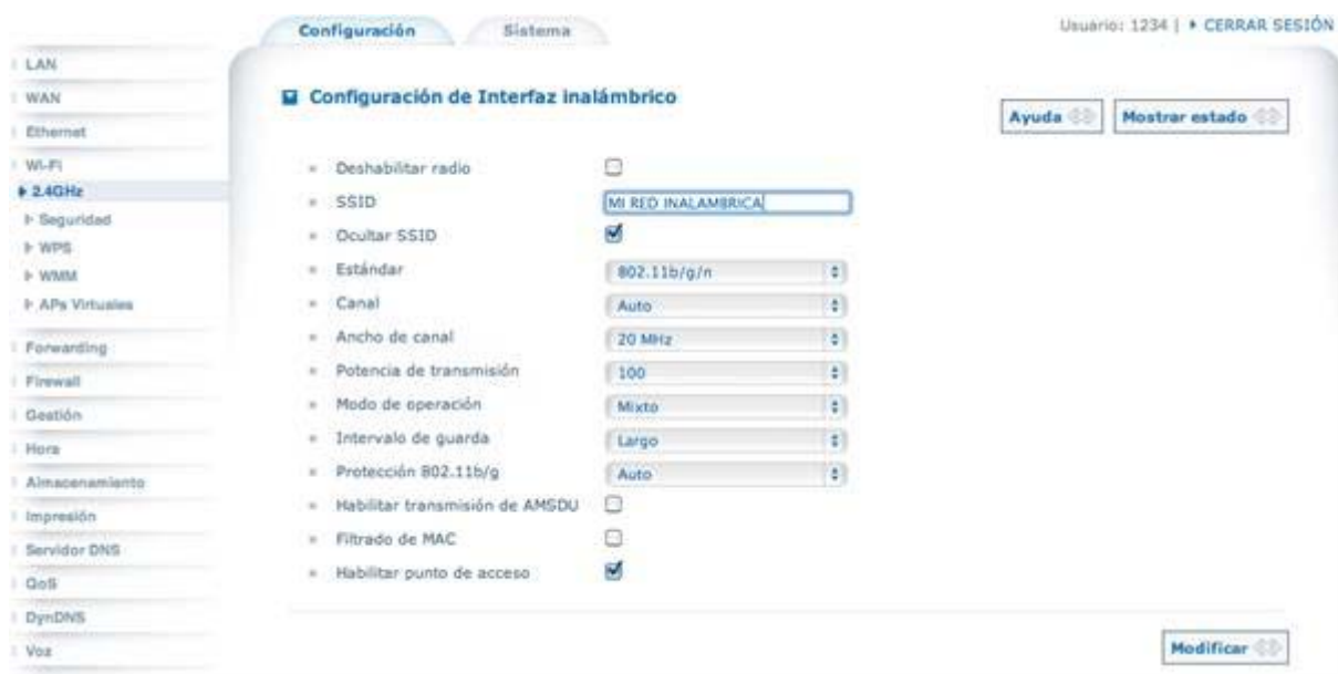
Figura 3. Configuración inalámbrica básica

Para ocultar el SSID o nombre de su red inalámbrica, por favor, seleccione el menú “Wi-Fi>2.4GHz”. El menú 2.4GHz permite configurar características de la interfaz inalámbrica del equipo capaz de trabajar en la banda de 2.4GHz. Puede activar o desactivar la interfaz LAN inalámbrica, esconder la red, establecer el nombre de la red inalámbrica (también conocido como SSID) y seleccionar el canal óptimo basándose en las redes inalámbricas próximas. Marque la casilla “Habilitar punto de acceso” para activar la interfaz inalámbrica. A continuación escriba un nombre de red distinto al configurado por defecto en el campo “SSID”. Finalmente, para ocultar el SSID, marque la casilla “Ocultar SSID”. Haga clic en el botón “Modificar” para dejar así configuradas las opciones básicas de su red inalámbrica.