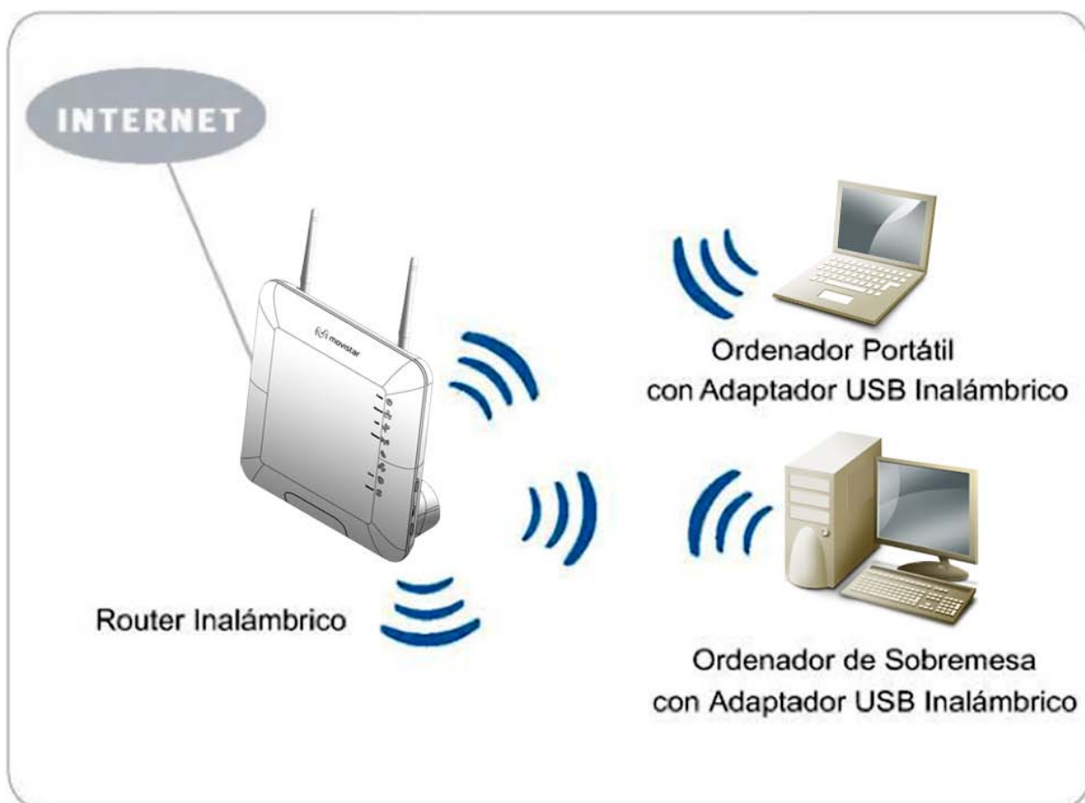
Figura 1. Aplicaciones WLAN