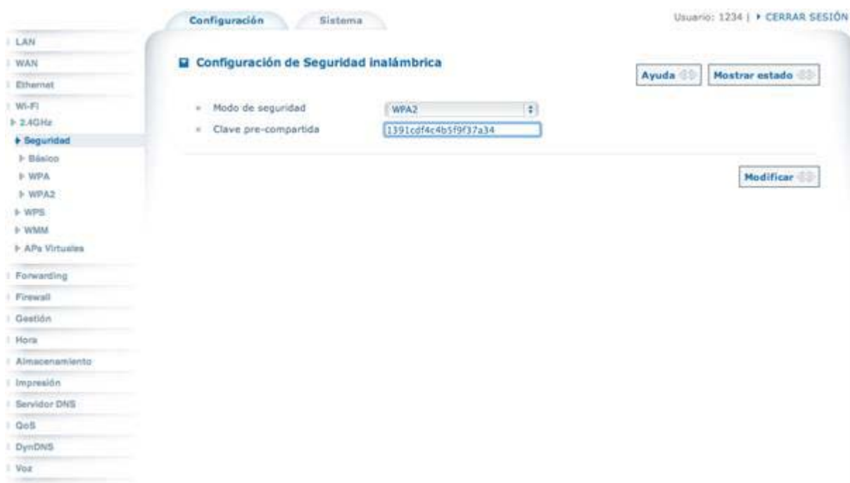
Figura 6. Cifrado WPA/WPA2

Para configurar el modo de cifrado, acceda al menú “Wi-Fi>2.4GHz>Seguridad” y seleccione WPA2 en el desplegable “Modo de seguridad”. Asimismo se recomienda cambiar la clave por defecto por una aleatoria de un mínimo de 20 caracteres. Para ello escriba la clave deseada en el campo “Clave pre-compartida”. Anote dicha clave en un lugar conocido porque será necesaria para conectar con sus clientes inalámbricos. Finalmente, pulse el botón “Modificar” para aplicar los cambios de seguridad realizados.