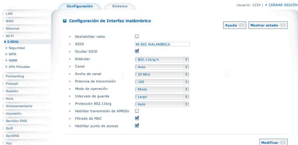
Figura 5. Filtrado de MAC