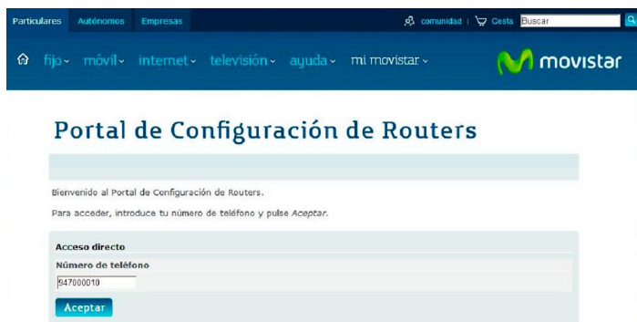
Figura 4-1: Portal de configuración del equipo

La configuración del equipo se puede realizar a través del portal de configuración remoto: www.movistar.es/configuramirouter