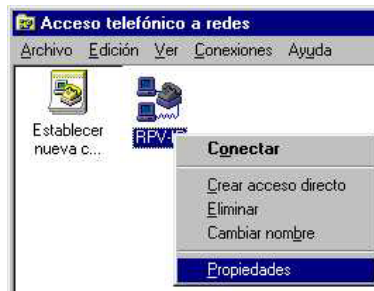
Figura 6: Propiedades de la conexión