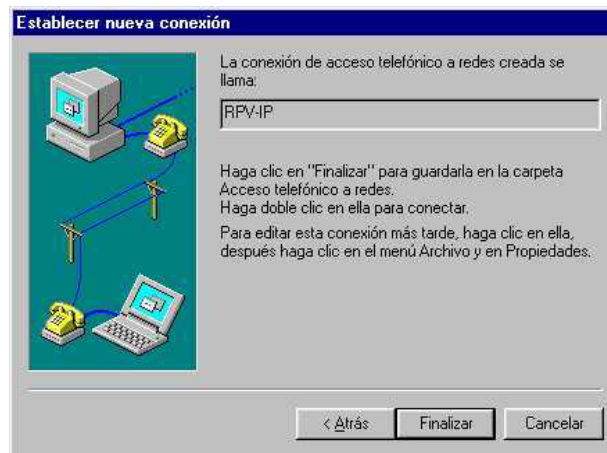
Figura 5: Fin de la configuración