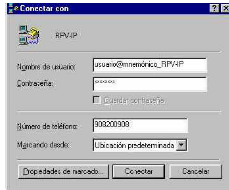
Figura 9: Inicio de conexión

Una vez seguidos todos estos pasos, sólo faltará pulsar conectar para acceder a la RPV.