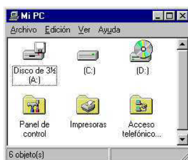
Figura 1: Pantalla de Mi PC