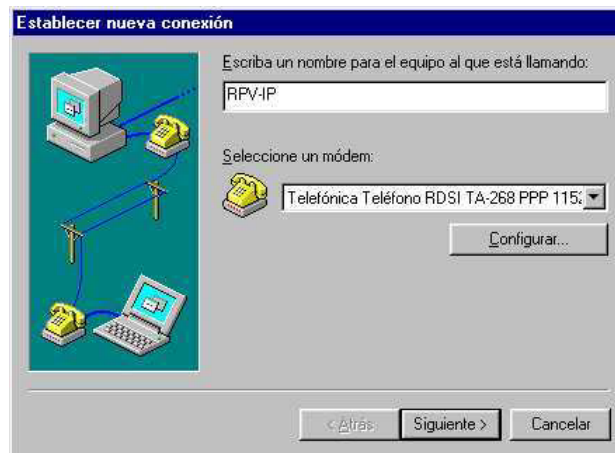
Figura 3: Nombre de la nueva conexión