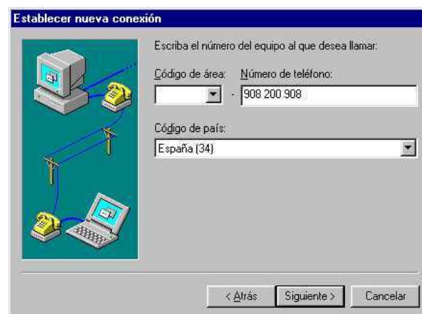
Figura 4: Configuración del teléfono destino