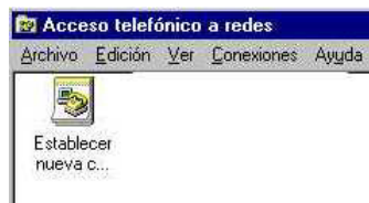
Figura 2: Acceso telefónico a redes